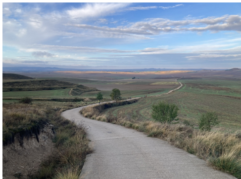
Aussicht aus Alto de Mostelares in Castrojeriz

Im Gegensatz zur Ankunft ist der Ausgang von Burgos bequem und relativ schnell; dann führen uns lange Feldwege und lose Steine in die ausgedehnten Getreidefelder von Kastilien. Dies ist der Beginn der Meseta und ein Vorgeschmack auf das, was uns erwartet, nämlich eine fast baum- und strauchlose Landschaft. Im Sommer ist es hier unerträglich heiß. Im Winter hingegen ist es bitterkalt.