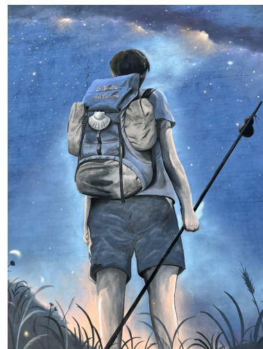
Wand-Streetart in Belorado

Bustransfer von Sahagún nach Bilbao (ca. 295 km) und Rückflug