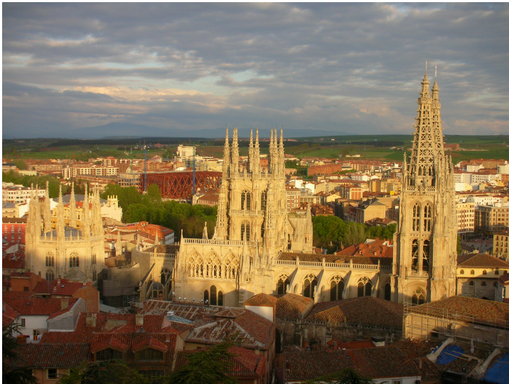
Kathedrale von Burgos