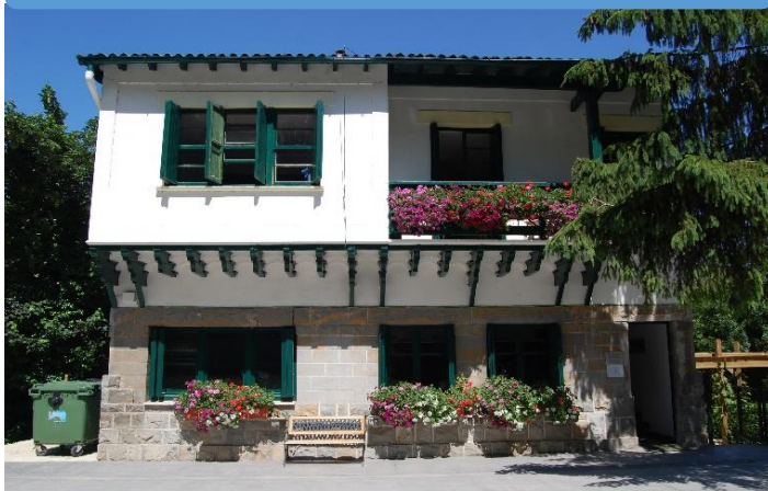
Unsere Pilgerherberge „Casa Paderborn“